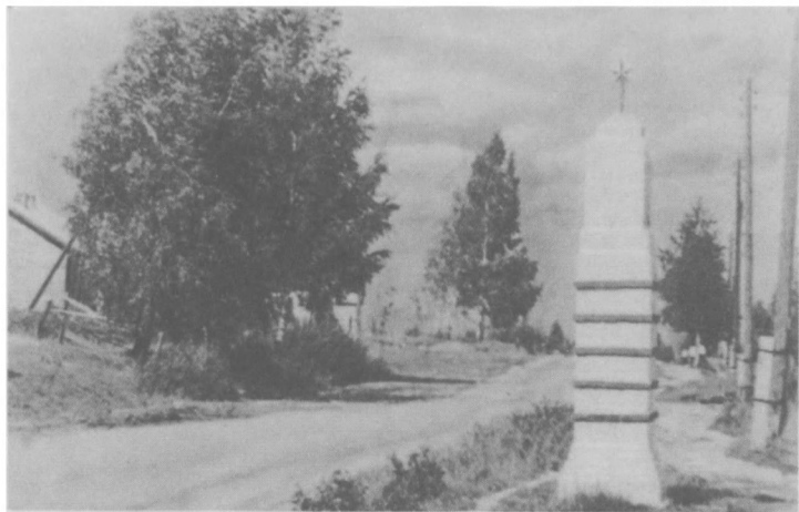
Памятник-obelisk в Пудоти